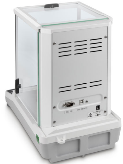
KERN ACS/ACJ avec interface de données standard RS-232 et USB

Le best-seller des balances d'analyse, avec un système de pesage de qualité supérieure Single-Cell, également avec approbation d'homologation [M]