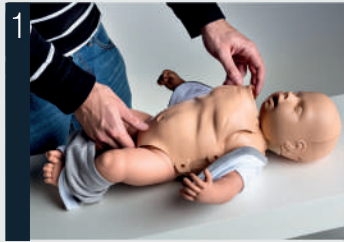
1 Retirer la peau du torse.