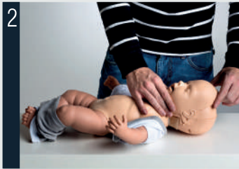
2 Retirer la peau du visage.