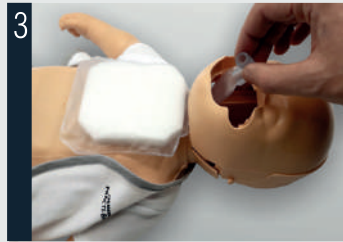
3 Passer le poumon par dessous la mâchoire.