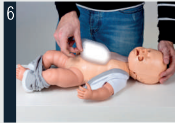
6 Placer le poumon sur la poitrine.