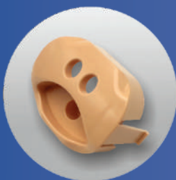
VALVE (Ref. SP-002 (PB))