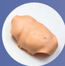
PEAU DU TORSE (Ref. Chest-PB)