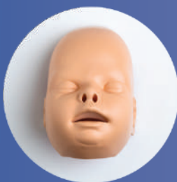
PEAU DU VISAGE (Ref. Face-PB)