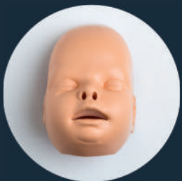
GESICHTSHAUT (Ref. Face-PB)