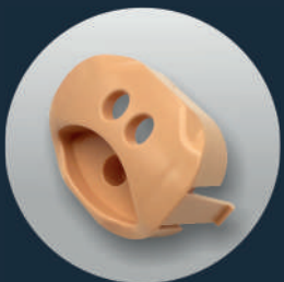
VENTIL (Ref. SP-002 (PB))