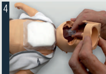
Schließen Sie die Lunge an das Ventil an.