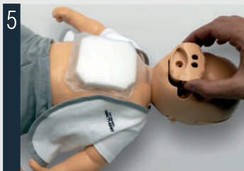
Stellen Sie sicher, dass das Ventil richtig am Kopf befestigt ist.