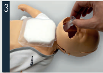
Legen Sie die Lunge unter das Kinn.