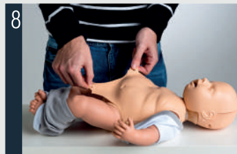
Platzieren Sie die Torsohaut auf dem Rumpf und befestigen Sie diese an den Stiften.