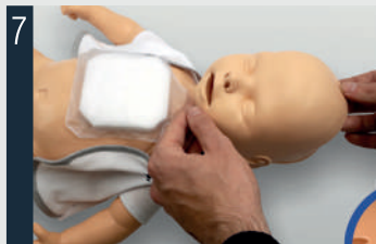
Platzieren Sie die Gesichtshaut und stellen Sie sicher, dass Nase, Mund und die Lasche am oberen Kopfende richtig zusammenpassen.