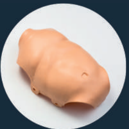
TORSOHAUT (Ref. Chest-PB)