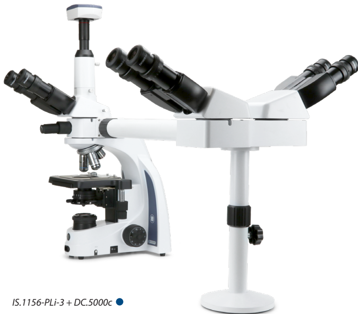
IS.1156-PLi-3 + DC.5000c ●