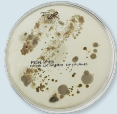
Empreinte digitale du résultat avant le lavage

Comparer les fiches APC après 2 jours et comparer la situation avant et après s'être lavé et en se lavant soigneusement les mains. Que pouvez-vous