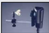
199015 met objectklem