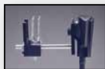
199015 met cuvet (voor oa. waterdiertjes)