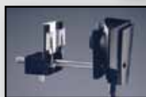
199015 met preparaathouder