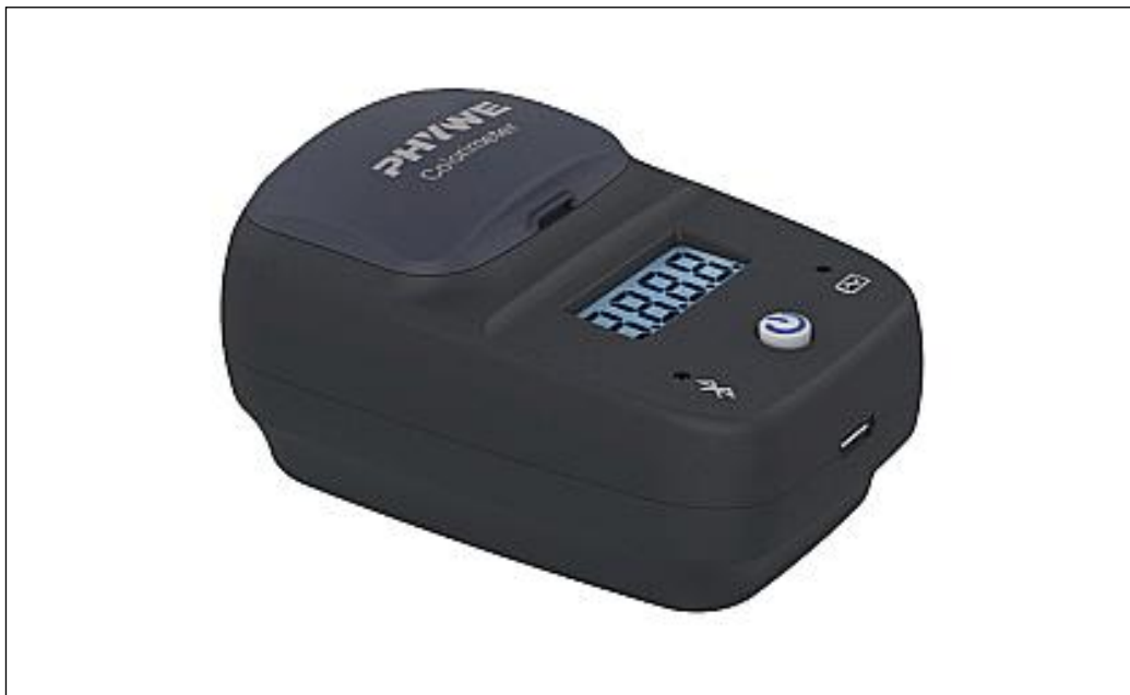
Abb. 1: 12924-01 Cobra SMARTsense Colorimeter & Turbidity