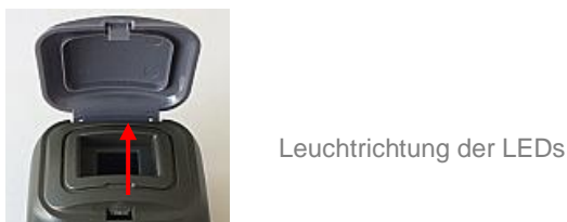
Abb. 3: Leuchtrichtung der LEDs