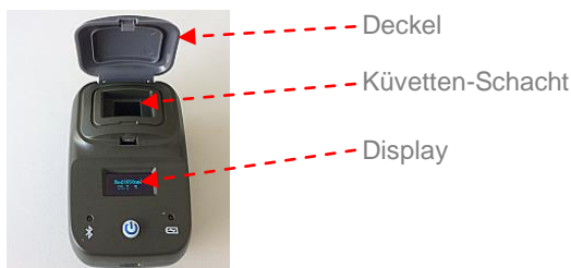
Abb. 2: Funktionselemente

Der Küvetten-Schacht befindet sich unter nach oben aufklappbaren Deckel.